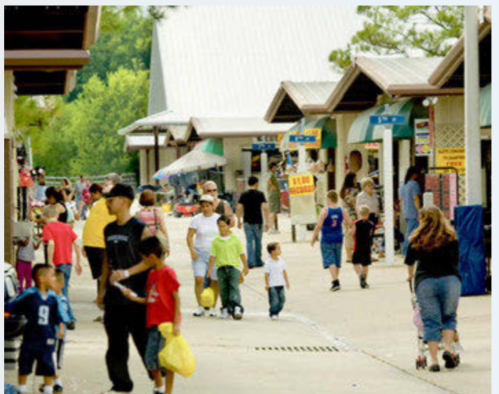
Nuevas mejoras peatonales en todos los cruces y conexiones con elementos peatonales actuales.