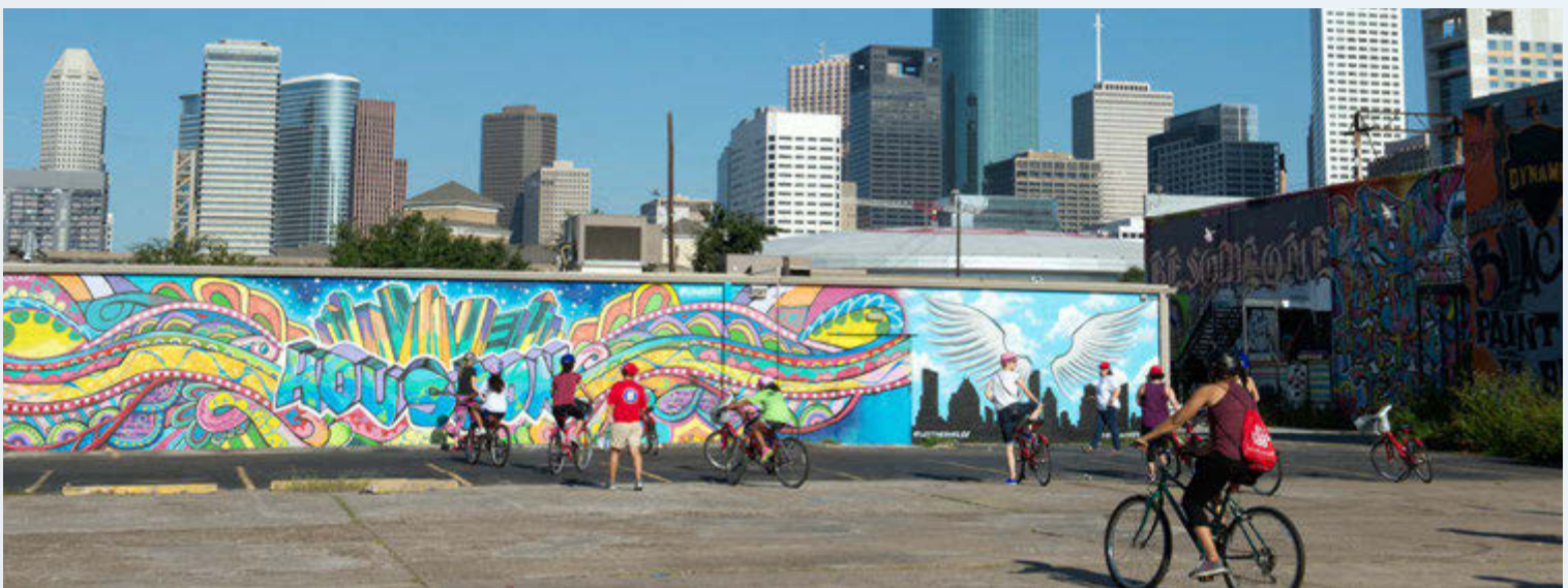
Nuevas instalaciones peatonales y de ciclistas pueden construir conexiones en el vecindario

Tanto si estos hogares son para inquilinos como si son de propietarios de viviendas de ingresos fijos, proporcionar estas mejoras esenciales es parte del esfuerzo de TxDOT por mantener a los residentes en sus hogares para que puedan seguir contribuyendo al tejido social de su comunidad.