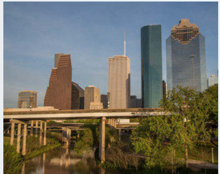
El proyecto de Mejora de Carreteras del Norte de Houston es el proyecto de transporte más grande de la historia reciente de nuestra ciudad.

El objetivo de TxDOT es ayudar a los hogares y a las personas a mantener sus redes de apoyo social actuales. Las interrupciones asociadas con el traslado pueden afectar el acceso de un residente a una estructura social fuerte construida con el tiempo. Esto puede incluir actividades comunitarias (iglesia y escuela) y otras rutinas regulares como compras de comestibles, cuidado de niños y servicios médicos. Las circunstancias individuales variarán, pero las poblaciones minoritarias, de bajos ingresos y de escasa competencia en inglés pueden ser especialmente vulnerables a tales impactos. TxDOT trabajará diligentemente para tratar de evitar que tales efectos ocurran.